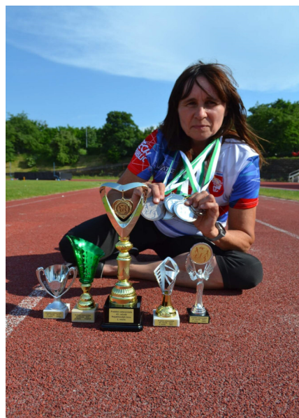
To vše se dá na PV vyhrát