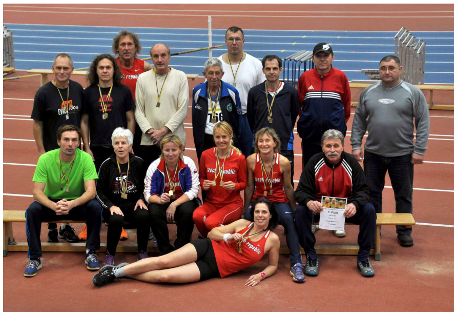
Účastníci veteránského halového mítinku v Chemnitz.