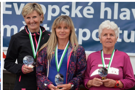
Pražská veteraniáda, 12. 6. 2016