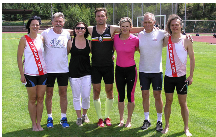
Východočeská veteraniáda, 16. 7. 2016