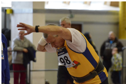
Foto-střípky ze závodů v roce 2016