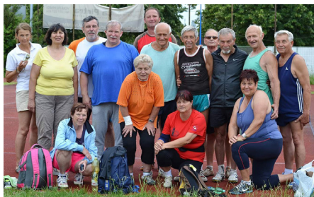
Západočeská veteraniáda, 2. 7. 2016