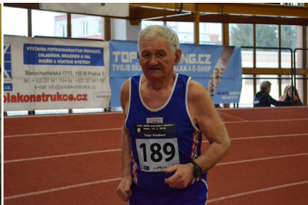
Halové MČR ve Stromovce, 12. 3. 2016.