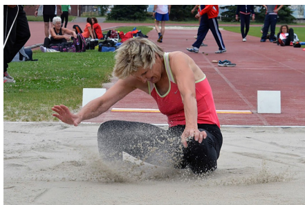
Pražská veteraniáda, 12. 6. 2016