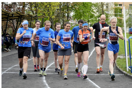
Libeňská veteraniáda, 23. 4. 2016