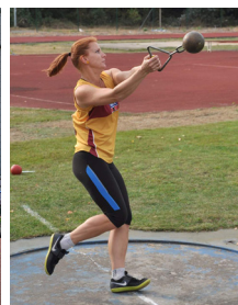
MU Čejkovice, 9. 7. 2016