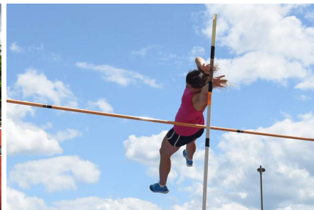
MČR ve Svitavách, 18. 6. 2016.