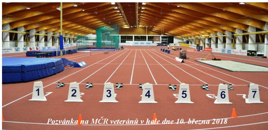
Pozvánka na MČR veteránů v hale dne 10. března 2018