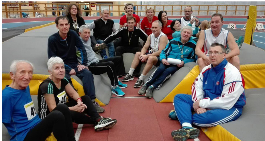
Halové závody v německém Chemnitz 2. 12. 2017