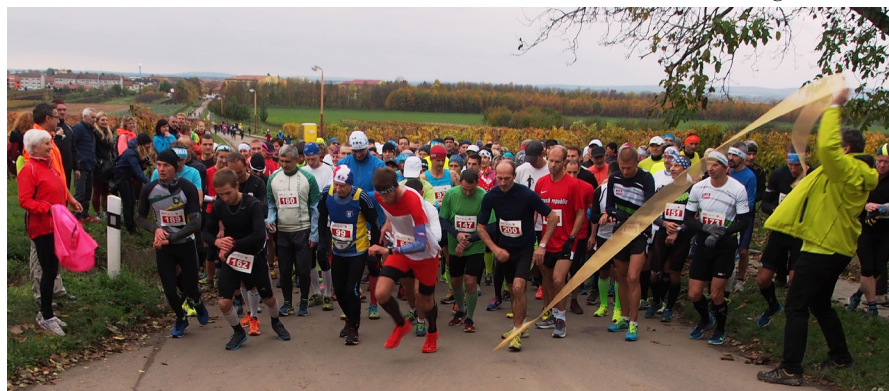
Start MČR v maratonu

Karel Matzner a Slávka Ročňáková, delegáti SV ČAS