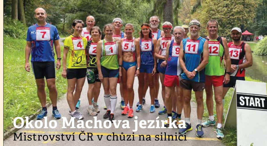
Okolo Máchova jezírka Mistrovství ČR v chůzi na silnici

V neděli 22. srpna 2021 se v Třebíči uskutečnilo Mistrovství ČR veteránů v chůzi na silnici. Závod byl perfektně připraven pořadatelským týmem Spartaku Třebíč v krásném prostředí Libušina údolí jen kousek od nově zrenovovaného větrného mlýna a Židovského starého města (zapsaného mezi památky UNESCO). Pro hlavní závod veteránského republikového mistrovství na desetikilometrové trati se bohužel sešlo pouze osm českých mužů a čtyři ženy. Účast zachraňovali zahraniční účastníci z Německa, Rakouska a Slovenska a přijelo také několik dětí z Vyškova a ze slovenského Borského Mikuláše. Stojí za zvážení, zda pro početnější účast napříště nepřidat veteránský šampionát k nějakému chodeckému závodu, který se počítá do bodování